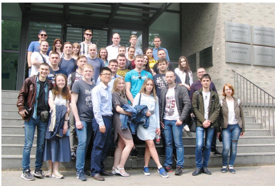
С ребятами из Омска и Новосибирска и нашим экскурсоводом в компании «Технологии управления движением»

С понедельника у нас началась учеба. Мы посетили Пекинский транспортный университет, множество лабораторий, лекций, а также урок китайского языка. Наверное, всей нашей группе он запомнился. Мы учили базовые фразы, цифры и правильное произношение. В Китае каждый слог характеризуется тем или иным тоном, который носит название