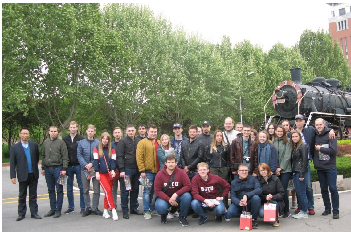
В Шаньдунском политехническом институте

В свободное время мы посетили смотровую башню, рынок и Олимпийский парк. Китай – страна будущего. Хочется приезжать туда и просто наблюдать, как мир совершенствуется и движется дальше. Хотя китайцы – это инноваторы, которые берут готовый продукт и усовершенствуют его. Тем самым становятся успешной и развивающейся страной.