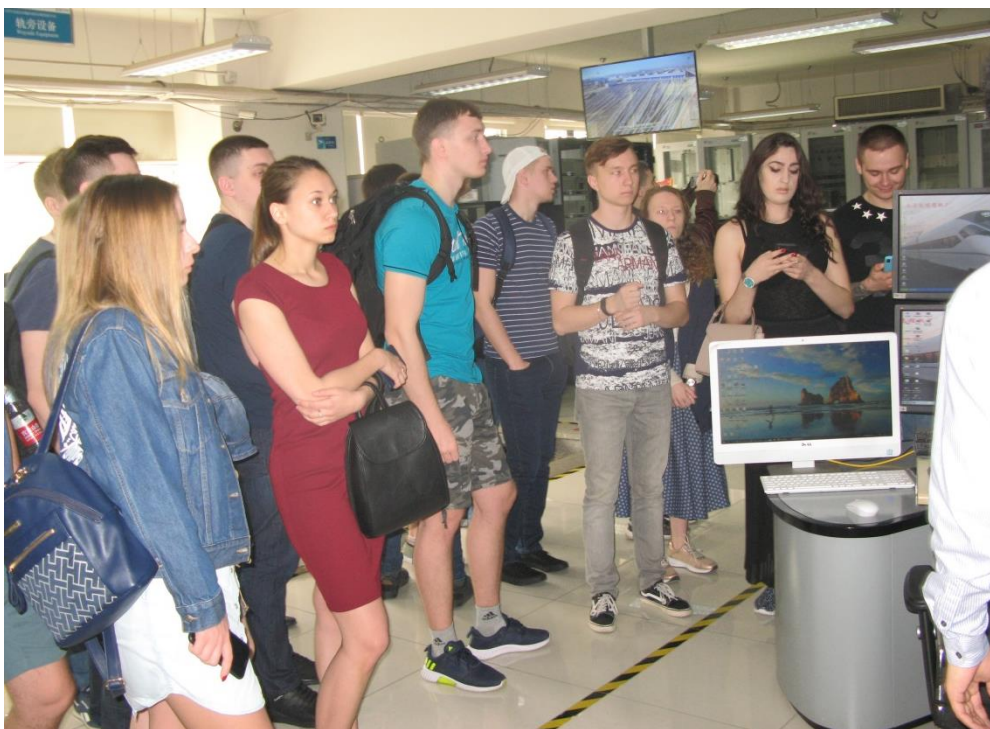
На экскурсии в компании «Технологии управления движением»