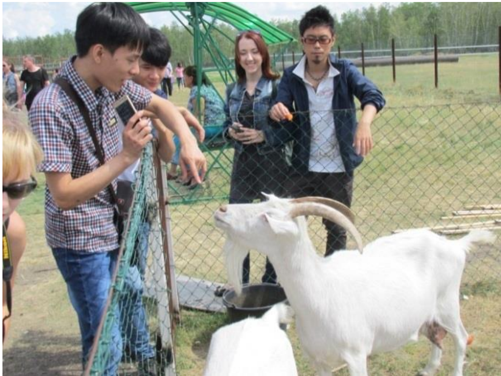
An der Straußenfarm

Die Studiendauer dieses Sprachkurses: 13-26 August 2018. Der Kurspreis ist 21 000 Rubel (inklusive die Kursgebühr, die Aufenthaltskosten und das Ausfluggeld).