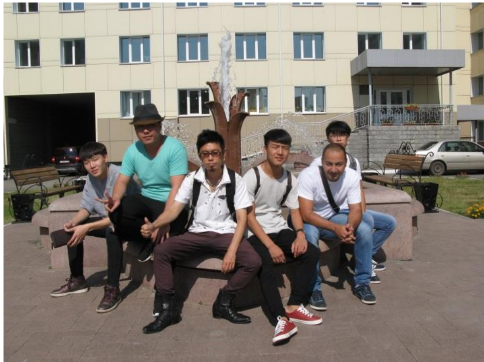
Neben dem Brunnen der Absolventen im Campus

Falls Sie den „Russischsprachkurs Intensiv“ besuchen möchten, müssen Sie sich bis Juni 2018 anmelden , um die Einladung zu bekommen: ums@omgups.ru .