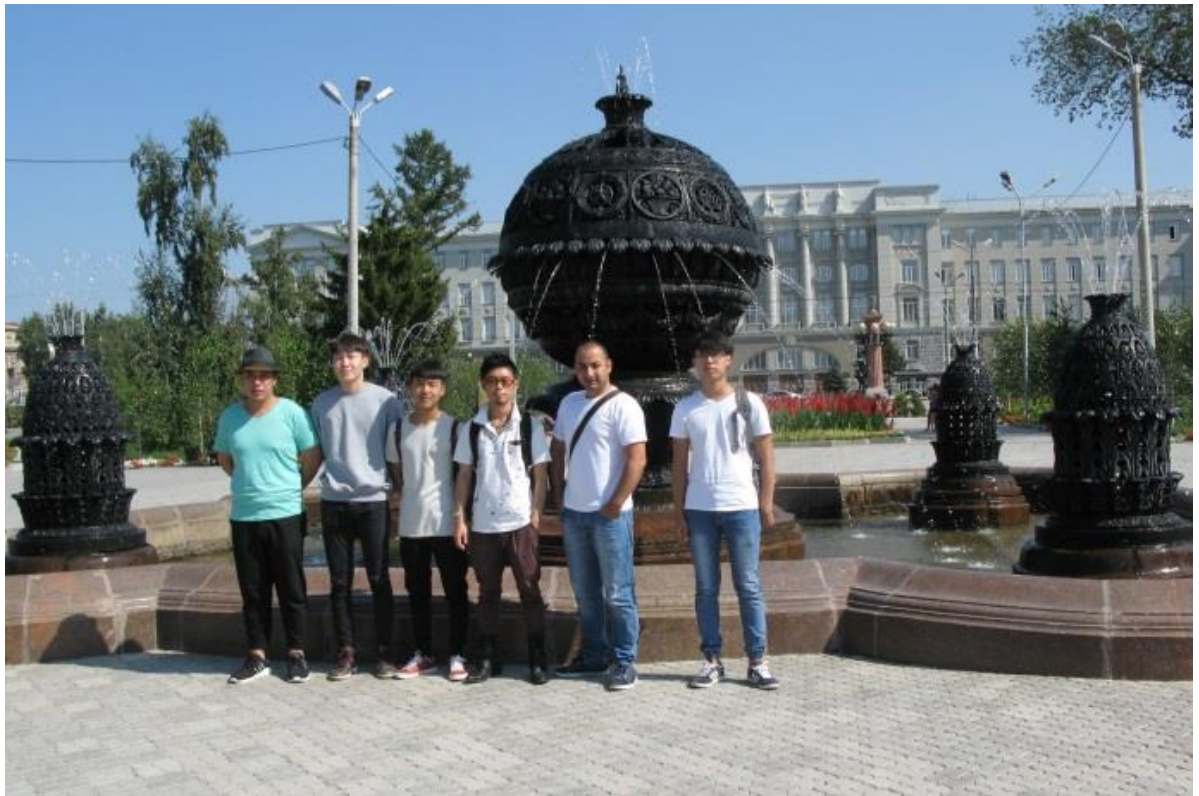
In der Parkanlage namens des dreißigjährigen Jubiläums des Leninschen Kommunistischen Jugendverbandes der Sowjetunion gegenüber der OSTU

Die Teilnehmer des Sprachkurses werden nicht nur an der Uni studieren, sondern auch interessante Veranstaltungen und Ausstellungen besuchen, und auch Ausflüge durch die Stadt Omsk und die Vororte machen.