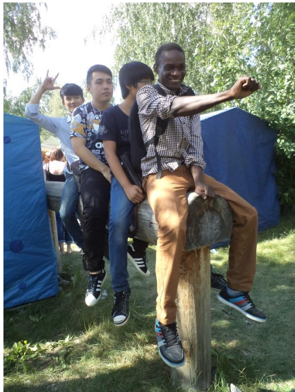
An der Ausstellung „Agro-Omsk“

Die Teilnehmer des Sprachkurses werden nicht nur an der Uni studieren, sondern auch interessante Veranstaltungen und Ausstellungen besuchen, und auch Ausflüge durch die Stadt Omsk und die Vororte machen.