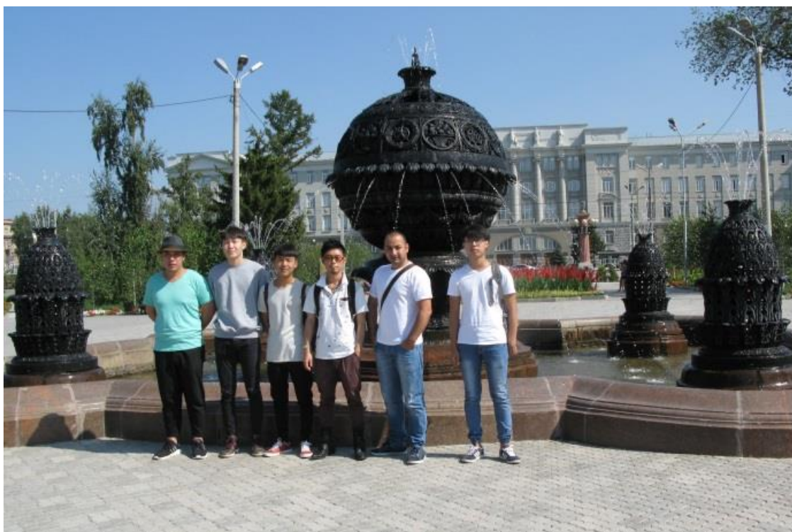
在鄂木斯克国立交通大对面的公园