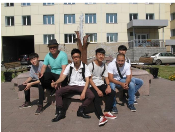
毕业生送给鄂木斯克国立交通大学的喷泉