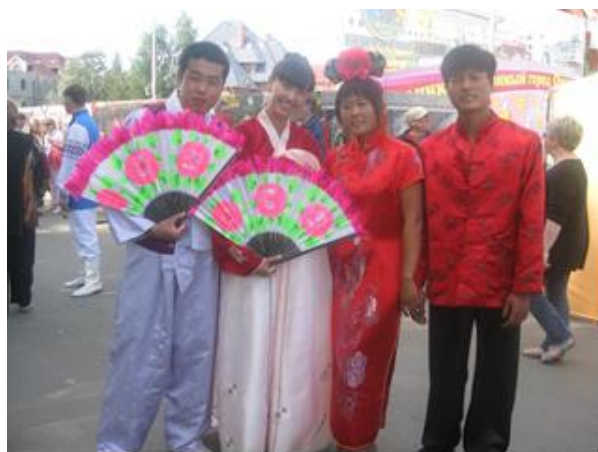
中国学生在鄂木斯克节

学习期限： 从 2018 年 8 月 13 号到 2018 年 8 月 26 号